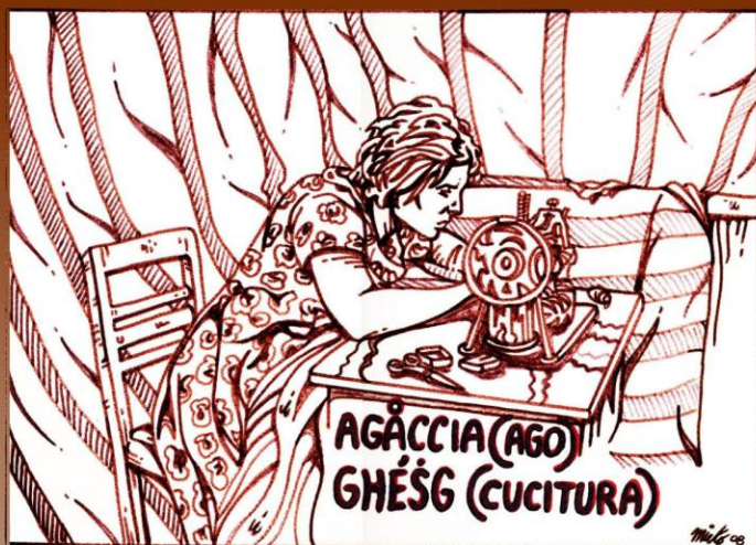
AGACCIA (AGO) GHÈSG (CUCITURA)